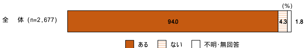
図表 2 - 2 - 6 - 1 現在の地域に住み続ける予定の有無(問6) ( 択一回答 )

現在の結婚状況でみると、結婚したことがない者と、配偶者あるいはパートナーとは離婚している者は「ない」(それぞれ 9.4%、7.3%) が高い。