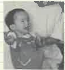
※写真は、ご本人が幼少時のものです。

ことはないと思っています。力強く生きることで苦難を乗り切るしかないのです。このサリドマイドが、現在、再び認可され使われています。多発性骨髄腫という血液のがんやハンセン病の症状に効果があることが分かったためです。薬そのものが悪いのではない—二度と同じような被害を起こさないために、この薬の危険性をよく知って、慎重に使用してほしいと思います。