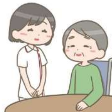
患者が看護師等という場合