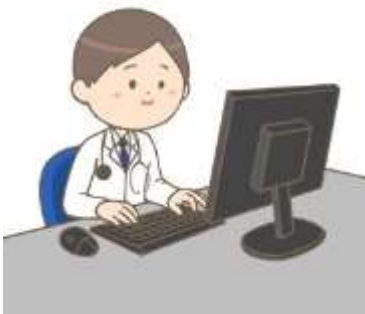
へき地診療所又はへき地医療拠点病院の医師