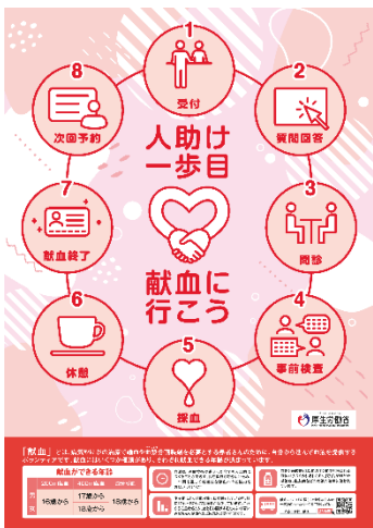
(1)③大学生等を対象とした 献血啓発ポスター