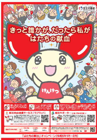
(1)④「私たちの献血」 キャンペーンポスター