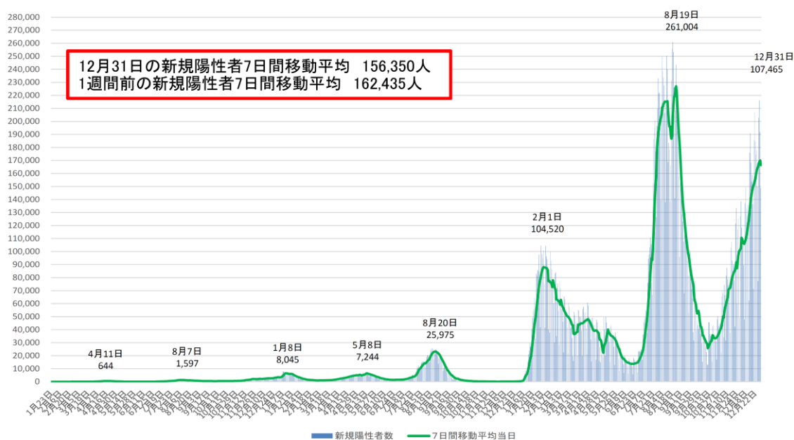
図 II-1. 新型コロナウイルス感染症の国内発生動向（令和 4 年 12 月 31 日）

日本では 2020 年 1 月 15 日に中国武漢市に滞在歴がある肺炎の患者が COVID-19 国内初症例として報告された。その後クルーズ船（ダイヤモンド・プリンセス号）や武漢市からの帰国者の感染者が報告され、翌 3 月には欧米などでの感染が疑われる患者の報告が増加し、その後 4 月上旬をピークに流行が認められた（いわゆる第 1 波）。次いで 6 月中旬から大都市を中心に 20～30 代の患者が増加し、8 月上旬をピークとしたいわゆる第 2 波、2021 年 1 月上旬（いわゆる第 3 波）、5 月上旬（アルファ株中心のいわゆる第 4 波）、8 月下旬（デルタ株中心のいわゆる第 5 波）、2022 年 2 月上旬（オミクロン株 BA.1、BA.2 系統中心のいわゆる第 6 波）、7 月下旬（オミクロン株 BA.5 系統中心）をそれぞれピークとする流行が発生した。令和 4 年 12 月 31 日 0:00 現在、国内での新型コロナウイルス感染症の感染者は 29,212,535 名（うち、空港・海港検疫事例 22,672 名）、死亡者は 57,266 名が確認されている（図 II-1） 1 。