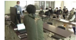
データを活用したスマート農業の取組（高知大学）