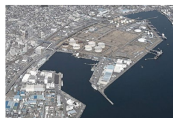
太陽光発電と大型蓄電池によるマイクログリッド（静岡県静岡市）