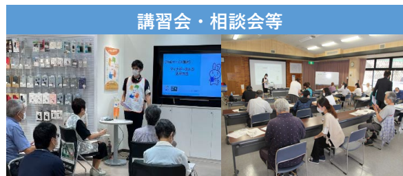
令和3年度デジタル活用支援推進事業（総務省）における講習会等の様子