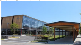
スマートシティAiCT（福島県会津若松市）