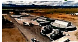
スマートなまちづくりプロジェクト（北海道上士幌町）